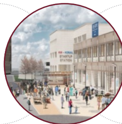
서울시 캠퍼스타운 조성사업 선정