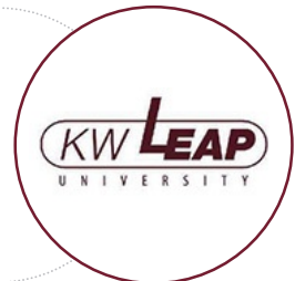
대학혁신지원사업 자율협약대학 선정