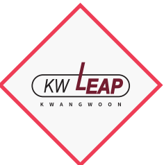
대학혁신지원사업 자율 협약대학 선정