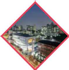
서울시 캠퍼스타운 조성사업 선정