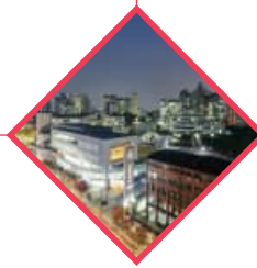
ソウル市キャンパス タウン造成事業選定