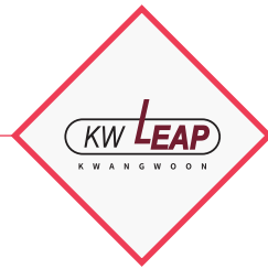
大学革新支援事業自律 協約大学選定