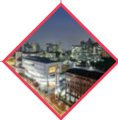
选定为构建首尔校园社 区的事业单位