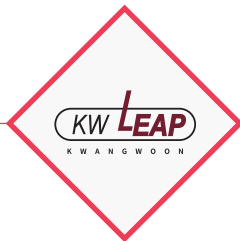
选定为支持大学创新的 自律协议大学事业单位